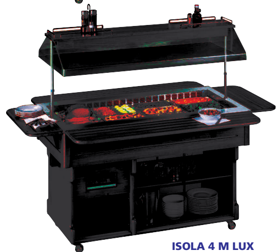
ISOLA 4 M LUX