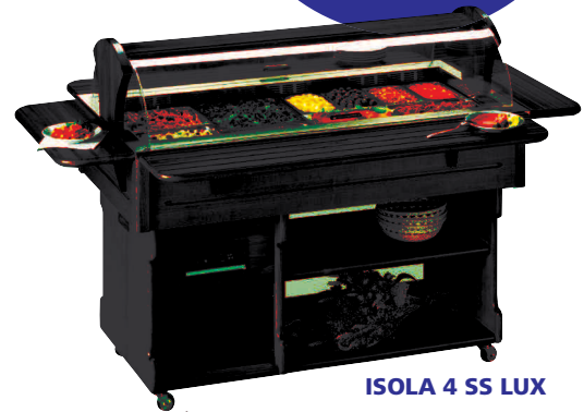
ISOLA 4 SS LUX