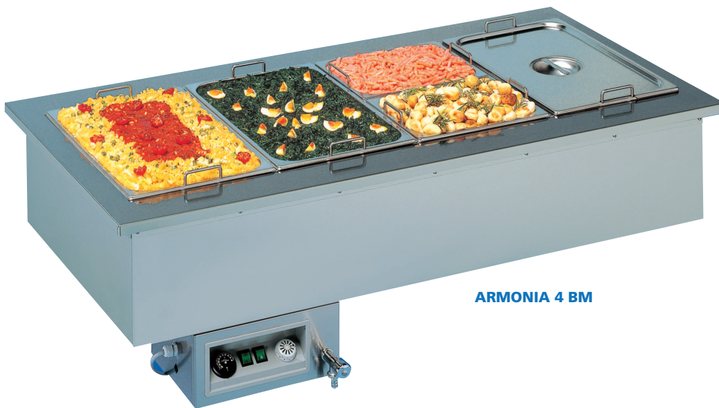
ARMONIA 4 BM