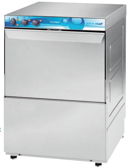
E GS 50 UNIVERSALSPÜLER