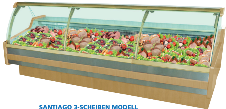
SANTIAGO 3-SCHEIBEN MODELL