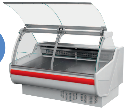
SANTIAGO 2-SCHEIBEN MODELL