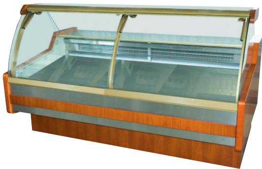
SANTIAGO 2-SCHEIBEN MODELL