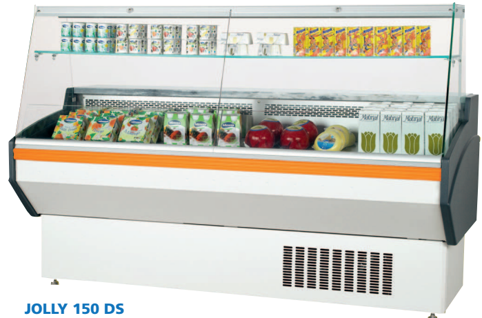
JOLLY 150 DS