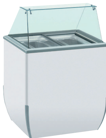
BRIO ICE 4 INDUSTRIE